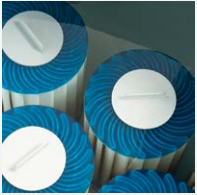
100% Filterung SilentFlo Umwälzung