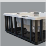
Polymer-Rahmen & Bodenwanne