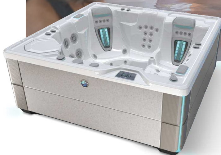
Mit Wanne in Alpine Weiß und Verkleidung in Blackwood

Personen Sitzplätze Düsen Spannung 5 Sitzplätze Liege 42 Düsen 230 V