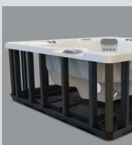
Polymer-Rahmen & Bodenwanne