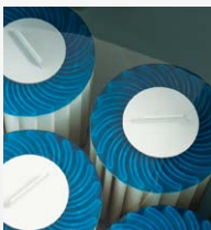
100% Filterung SilentFlo Umwälzung