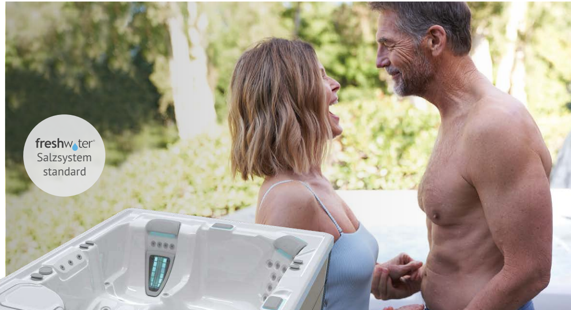
Mit Wanne in Alpin Weiß und Verkleidung in Gebürstetem Nickel